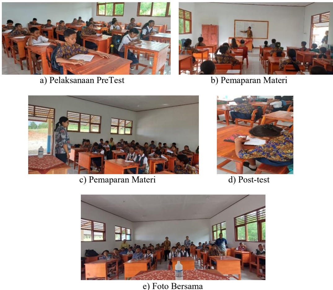
a) Pelaksanaan PreTest

Kegiatan sosialisasi dilaksanakan di SMP SATAP Negeri Nian yang diawali dengan pemberian pre-test kepada 17 peserta yang dilanjutkan dengan pemberian materi. Materi yang disampaikan yaitu mengenai kode resin plastik, contoh benda yang mempunyai kode resin tersebut, bahaya kesehatan, konsep reduce, reuse, recycle (3R), dan contoh benda hasil daur ulang. Saat kegiatan pemaparan berlangsung, peserta mengalami penambahan menjadi 31 orang karena permintaan guru agar lebih banyak siswa yang mengetahui tentang kode resin plastik. Setelah responden diberikan materi, kemudian responden diberikan post-test. Pernyataan dalam kuisisioner yang diberikan pada pretest dan posttest sama dengan tujuan melihat kemampuan responden untuk menyerap materi yang disajikan. Seluruh kegiatan pengabdian dapat dilihat pada gambar 1.