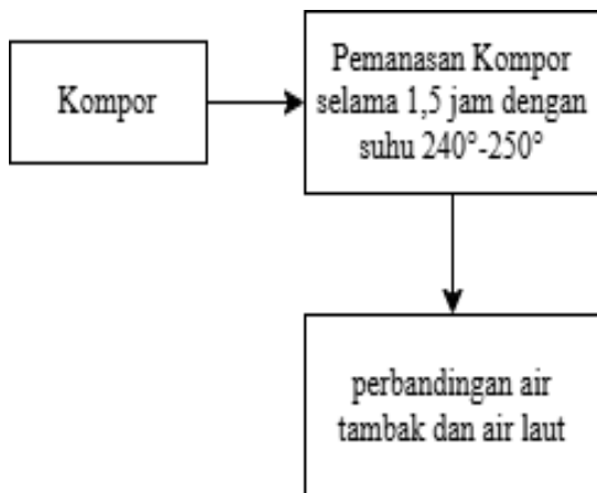
Gambar 1. Blok Diagram

Blok diagram di atas menggambarkan suatu proses pemanasan yang menggunakan kompor sebagai sumber panas utama. Dalam proses ini, kompor digunakan untuk proses pemasakan garam selama 1,5 jam pada suhu tinggi, yaitu antara 240°C hingga 250°C. Setelah proses pemanasan selesai, lalu dilakukan perbandingan untuk mengukur kualitas garam dari air laut dan air tambak, masing-masing pengukuran dilakukan 1,5 jam untuk mencari data perbandingan.