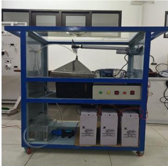
Gambar 3. Desain Alat

Pada Gambar 3 terlihat desain alat untuk proses pemasakan garam. Alat ini di desain dengan 3 sekatan, sekatan pertama terdapat actuator untuk menyorok garam supaya keluar di tempat yang sudah disediakan, dan panci stenlis sebagai wadah untuk proses pemasakan, selanjutnya sekatan ke dua ada panel control automatic sebagai proses mulainya pemasakan, dan kompor otomatis untuk pengapian pada proses pemasakan garam, lalu sekatan yang ketiga terdapat ada baterai untuk menyimpan energi untuk mensuplay system pada proses pembuatan garam, pompa sebagai mengalirkan air pada panci dan tempat untuk penyimpanan air laut dan H 2 O.